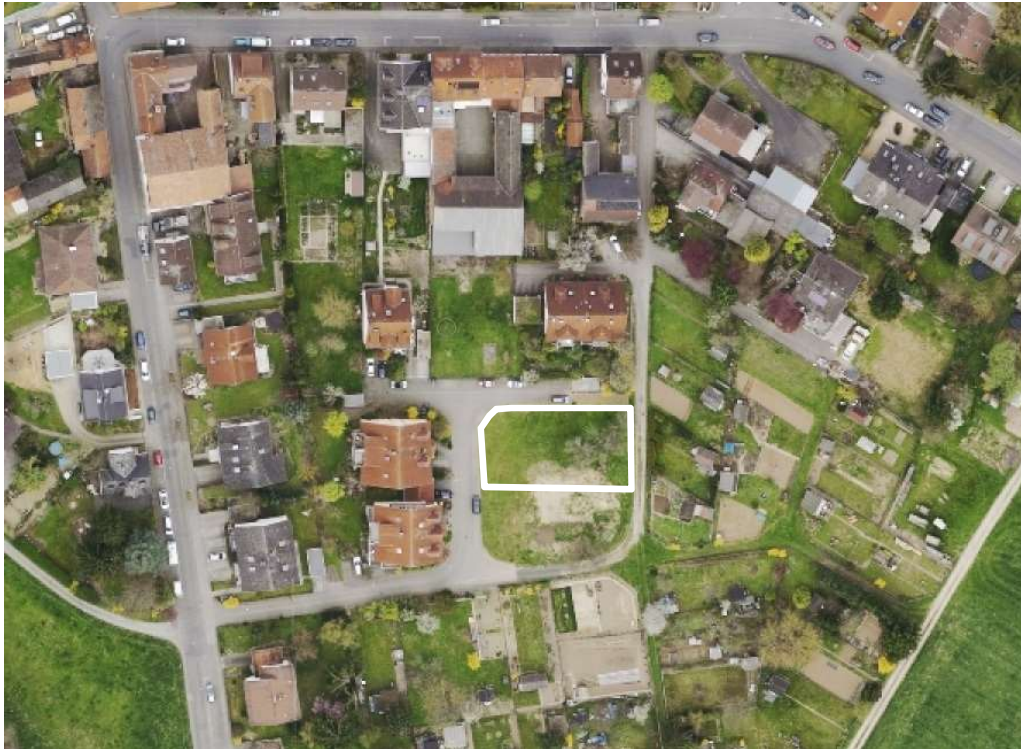
Luftbild (März 2014)