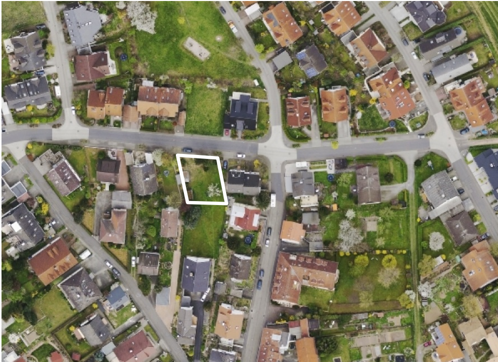
Luftbild (März 2014)