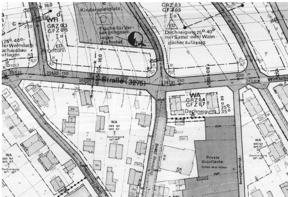
Ausschnitt aus dem Bebauungsplan

Erstellt: Stadtplanungsamt Gustav-Stresemann-Ring 15 65189 Wiesbaden stadtentwicklung@wiesbaden.de