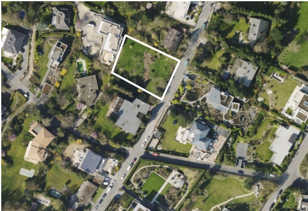
Luftbild (März 2014)