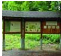
Wissenswertes am Wegesrand