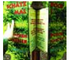
Schätze den Baum