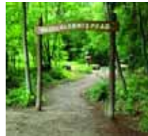
Hier geht's los!