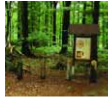
Anatomie des Baumes