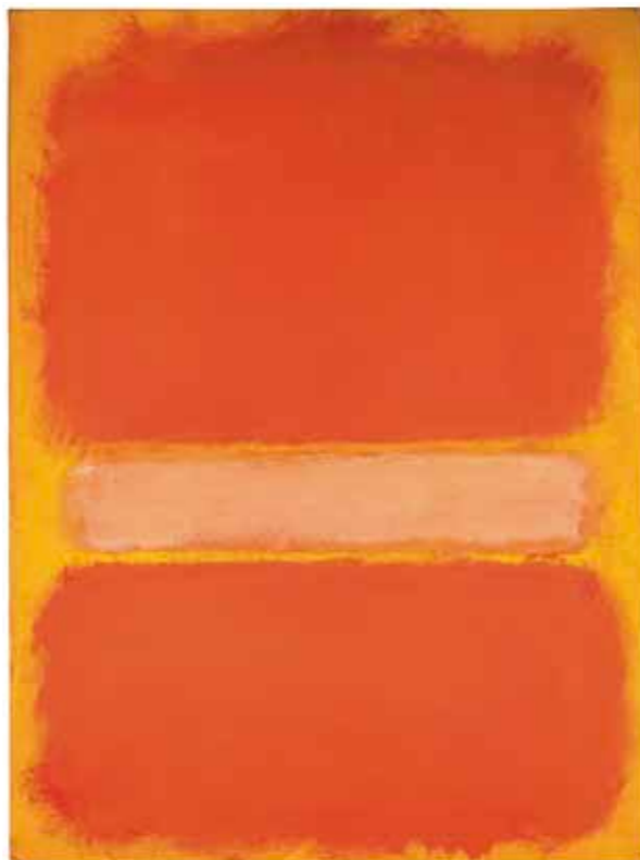
Mark Rothko Untitled, 1956 Öl und Gouache auf Papier auf Leinwand, 74,4 x 55,5 cm Ulmer Museum – 1978 Stiftung Sammlung Kurt Fried

Der Vorstoß ins Reich des Sublimen: Zur Programmatik von Malern des Abstrakten Expressionismus