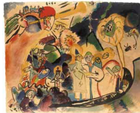
Wassily Kandinsky Allerheiligen, um 1910 Aquarell auf Zeichenkarton, 38 x 47 cm Museum Wiesbaden, Dauerleihgabe des Vereins zur Förderung der Bildenden Kunst in Wiesbaden e.V., Sammlung Hanna Bekker vom Rath

Synthese und Synästhesie: Farbe, Form und innerer Klang