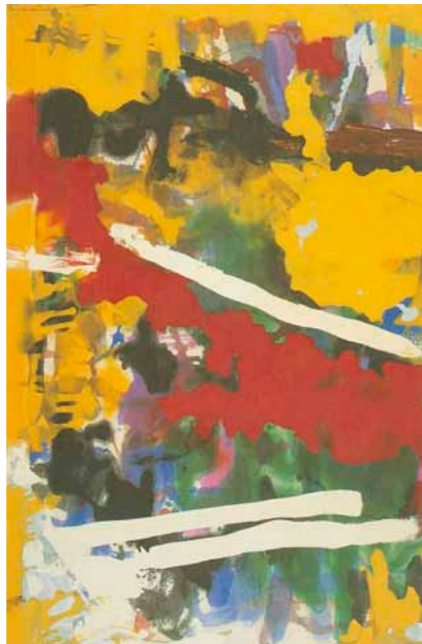
Morris Louis Untitled, 1955 Öl auf Leinwand, 200,7 x 131 cm Privatsammlung

Farbstarke Räume mit Werken von Adolph Gottlieb, Hans Hofmann, Morris Louis, Robert Motherwell, Barnett Newman und Mark Rothko