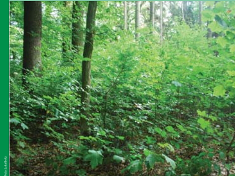
Naturverjüngung im Mischwald