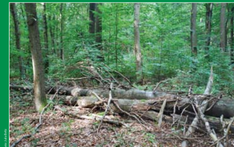
Unbewirtschaftete Fläche mit so genanntem Biotopholz