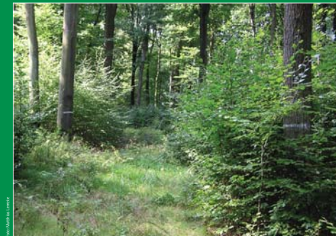
Rückegasse mit markierten Randbäumen