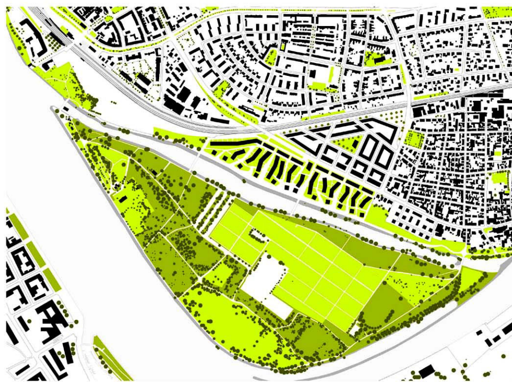
Strukturplan M 1:5000