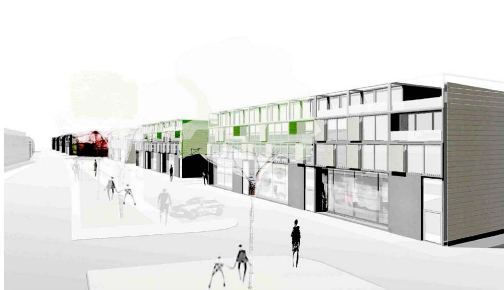
Perspektive Kostheimer Landstrasse