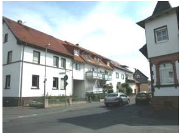
Veränderung der Bebauung an der Hellgasse

Aber auch bei einem Erhalt der Gebäudeform wurde das äußere Erscheinungsbild der Häuser stark verändert. Die prägenden Sprossenfenster und Klappläden wurden durch Einflügel Fenster ausgetauscht. Bei vielen Häusern wurde die Fassade erneuert, dabei wurden die Gebäude mit liegenden Fensterformaten im Stil der 60-er und 70-er Jahre versehen.