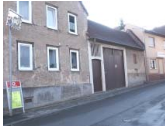
Veränderungen der Fassaden