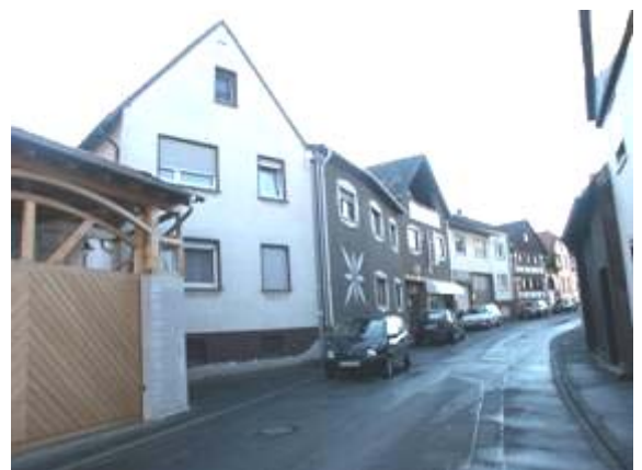
Veränderungen eines ganzen Straßenzuges