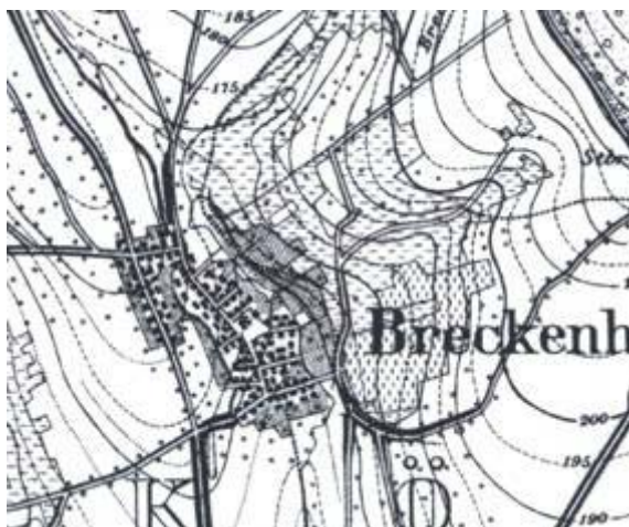
Karte von 1895

Im Vergleich zu anderen Orten im Umkreis, wurde durch diese Entwicklung in Breckenheim kein besonders ausgeprägter Entwicklungsschub ausgelöst. Entsprechend war das Bevölkerungswachstum nur gering. Von 702 Einwohnern im Jahr 1843 stieg die Einwohnerzahl bis 1913 auf 766 und bis 1939 auf 826. Auch um 1900 dominierte in Breckenheim noch die Landwirtschaft. Der Wandel zu einer Wohngemeinde vollzog sich erst in den 60-er Jahren im Zuge einer immer stärker werdenden Stadtrand-Wanderung.