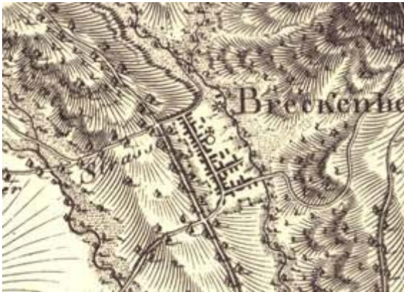
Karte von 1801

Vor dem Dreißigjährigen Krieg lebten in Breckenheim ca. 150 Einwohner, nach Kriegsende waren 8 Einwohner verblieben. 1677 lebten hier wieder 30 Familien. Erst in den Jahren 1718 – 1724 konnten die Kirche und das Schulhaus wieder aufgebaut werden.