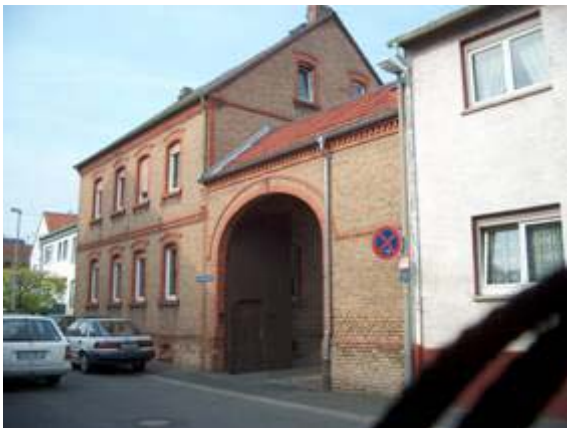
Gründerzeitliche Hofreite in der Karl-Albert-Straße

Teilweise entstanden auch neue landwirtschaftliche Gehöfte, die immer noch nach dem Bauprinzip der Hofreiten errichtet wurden; nun aber mit einem Wohnhaus, welches traufständig an der Strasse stand. Neue gründerzeitliche Hofreiten entstanden an der "Karl-Albert-Straße".