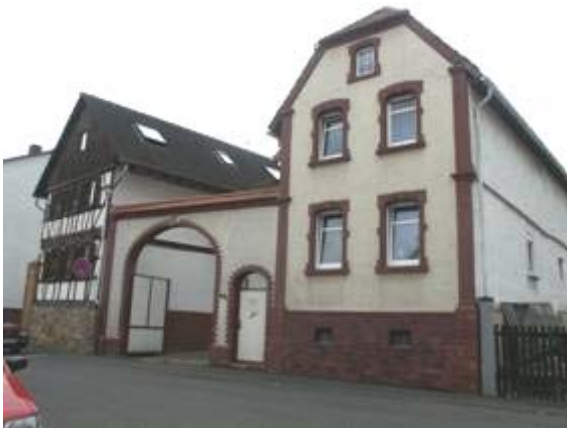
Gründerzeitliches Wohnhaus einer älteren Hofreite an der Alten Dorfstraße

So entstanden innerhalb der vorhandenen Hofreiten massiv gebaute Ställe und Scheunen. Zahlreiche Torhäuser entstammen dieser Zeit. Auch wurden teilweise vorhandene Fachwerk-Wohnhäuser durch neue Wohnhäuser ersetzt.