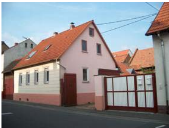
Vorgründerzeitliche kleinbäuerliche Hofreite in Breckenheim

Nach 1820 werden die Wohnhäuser traufständig errichtet. Die Bebauung entlang der "Hellgasse" und dem nördlichen und südlichen Abschnitt der "Alten Dorfstraße" zeigt dies deutlich. Hier entstehen nun teilweise auch kleinere Gehöfte. Die kleineren Hofreiten sind nach dem selben Bauprinzip der Hofreite errichtet, mit einem Stall an der seitlichen Grenze und einer querstehenden Scheune an der Rückseite des Hofes. Die traufständigen Wohngebäude sind oft nur eingeschossig.