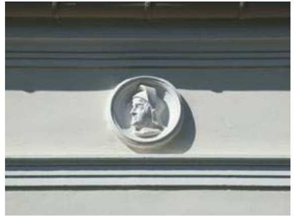
Schmuck der Backsteingebäude