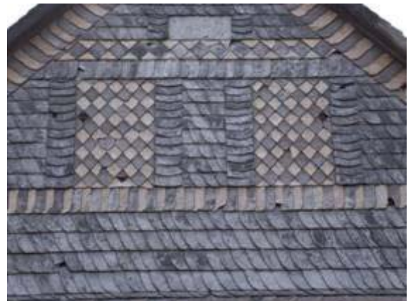
Schmuck der Torhäuser