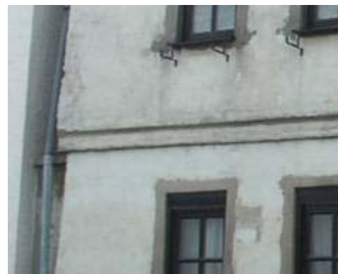
Fenstereinfassungen mit Holz-Bekleidung