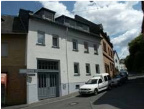
Traufständiges Wohnhaus mit Tordurchfahrt