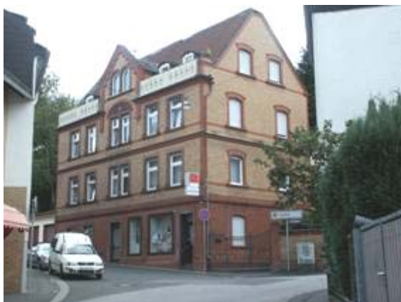
Gründerzeitliches Wohn- und Geschäftshaus

Vermeint entstanden in Rambach auch Wohn- und Geschäftsgebäude, die keine Anlagen für den landwirtschaftlichen Nebenerwerb enthielten. In Rambach ist diese Form des gründerzeitlichen Wohn- und Geschäftshauses häufig vertreten.