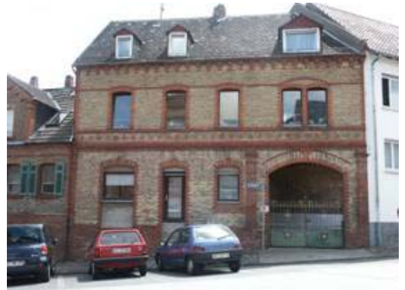
Wohn- und Geschäftshaus Am Ringwall 2

Die Gründerzeit ist auch verbunden mit einem Entwicklungsschub in der Landwirtschaft. Die umliegenden Dörfer übernahmen nun zunehmend die Zulieferfunktion für die Stadt. Die wirtschaftliche Entwicklung der Landwirtschaft hinterließ auch in Rambach Spuren im Ortsbild, jedoch nicht so ausgeprägt wie in manchen Nachbarorten. Viele der heute noch vorhandenen Ställe und Scheunen wurden in dieser Zeit zwischen 1870 und 1910 gebaut.