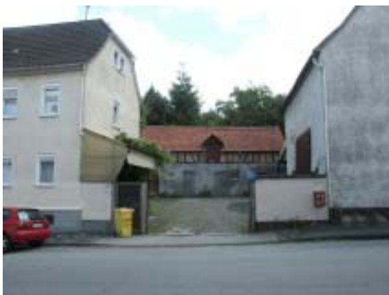
Vorgründerzeitliche Hofreite aus der 1. Hälfte des 19. Jahrhunderts

Nach 1820 wurden die Wohnhäuser in der Straße traufständig errichtet. Die Bebauung entlang der "Kehrstraße" und der Straße "Am Burgacker" ist noch heute dadurch geprägt. In dieser Zeit entstanden oft nur kleinere Gehöfte. Immer mehr Familien mussten sich die vorhandene Wirtschaftsfläche teilen, wodurch die Zahl der Betriebe anstieg, die Größe schrumpfte. Auch die kleineren Hofreiten sind nach dem Bauprinzip der Hofreite angelegt: Ein Stall an der seitlichen Grenze und eine querstehenden Scheune an der Rückseite des Hofes. Die Wohngebäude sind oft nur eingeschossig.