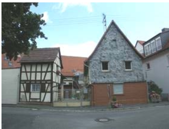
Vorgründerzeitliche Hofreite in Rambach

Bedingt durch die in dem engen Tal zur Verfügung stehende Fläche sind die Grundstücke entlang der Dorfstraßen relativ klein und schmal. Die Bebauung der einzelnen Grundstücke erfolgte auch hier wie in allen Nachbarorten nach einem durchgängigen Prinzip: Auf den schmalen Parzellen wurde direkt an der Straße ein meist giebelständiges Wohnhaus errichtet. Die Hofreiten erhielten im Laufe des 18. Jahrhunderts zunehmend separate Stallgebäude und Scheunen, die an der Rückseite des Grundstücks als Quergebäude einen Abschluss des Hofes bildeten. Hinter den Scheunen waren Gärten angelegt, soweit es die Platzverhältnisse zuließen. Die Gehöfte sind insgesamt sehr klein. Bedingt durch die bewegte Topografie und die enge Tallage war die landwirtschaftliche Bewirtschaftung sehr mühsam und ließ daher keine großen Betriebe entstehen.