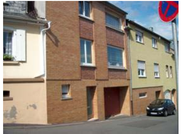
Überbauung eines Hofes in der Trompeterstraße

Aber auch unter Beibehaltung der Gebäudeform wurde das äußere Erscheinungsbild der Häuser stark verändert und "leergeräumt". Die prägenden Sprossenfenster wurden durch Einflügelfenster ausgetauscht. Gliederungselemente wie Klappläden und Spaliergerüste einschließlich der Hausrebe verschwanden.