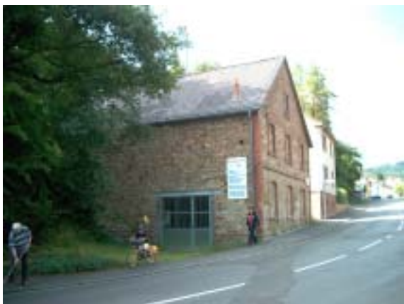
Eishaus in der Niedernhausener Straße

Bedeutung war die Eisproduktion in Rambach. Die Wiesen im Rambachtal oberhalb von Rambach wurden im Winter geflutet und das dort gewonnene Eis in Eishäusern eingelagert. Dieser besondere Gebäudetyp des "Eishauses" ist noch an der "Niedernhausener Straße" Nr. 114 zu sehen, allerdings schon stark verändert.