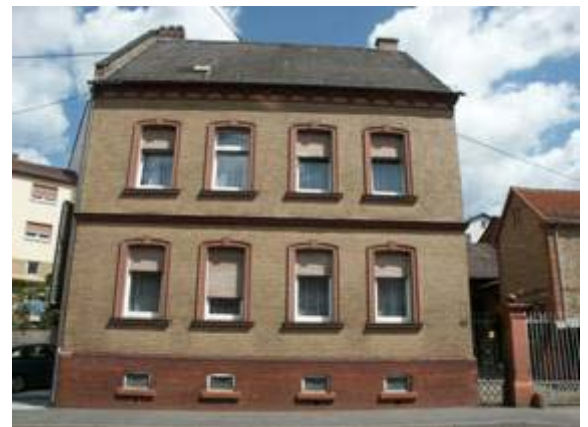
Gründerzeitliche Hofreite in der Niedernhausener Straße

Zwei besondere Formen der Zulieferfunktion für die Stadt Wiesbaden sollen hier noch erwähnt werden. An der Straße nach Wiesbaden entstand ein großer Wäschereibetrieb, der vor allem die Wiesbadener Hotels belieferte. Ebenfalls von