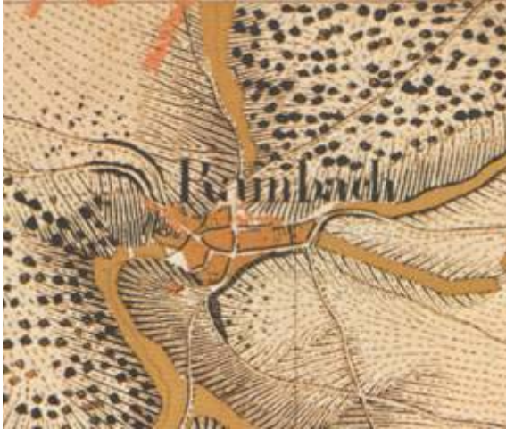
Karte von 1819

Die Bebauung des Ortskerns von Rambach in seiner heutigen Form beginnt, wie in fast allen Orten im Umkreis, erst nach dem Dreißigjährigen Krieg. Auch Rambach hatte im Dreißigjährigen Krieg schwer zu leiden. Die Gemarkung war vollständig verwildert. 1673 wurde Rambach durch eine Brandkatastrophe erneut zerstört. 1705 zählte man hier 105 Einwohner.