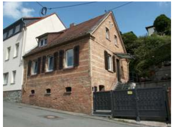
Arbeiter- und Handwerkerhäuser in Rambach

Vermeint entstanden in Rambach auch Wohn- und Geschäftsgebäude, die keine Anlagen für den landwirtschaftlichen Nebenerwerb enthielten. In Rambach ist diese Form des gründerzeitlichen Wohn- und Geschäftshauses häufig vertreten.