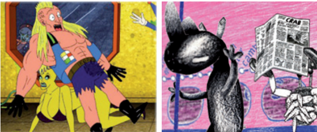
King Star King Lucy

17.30 Uhr (Wiederholung am Sonntag, 20.30 Uhr) Best of International Animation 2014/15 (4)