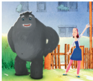
Trudes Tier: Der Tanz

Ein internationales Programm mit außergewöhnlichen und fantasievollen Trickfilmen für Kinder, speziell zusammengestellt für die traditionelle Sonntagsmatinee. U.a. die preisgekrönten Filme Der Schlips (Belgien), Der Elefant und das Fahrrad (Frankreich), Polo: Der Tag, an dem ein Stern vom Himmel fiel (Luxemburg/Frankreich), Der Handschuh (Frankreich/Belgien), Pik pik pik (Rußland), The Magic Time (Norwegen), Trudes Tier: Der Tanz (Deutschland). Laufzeit: ca. 65 Minuten. Empfohlene Altersgruppe: ab 3 Jahre.