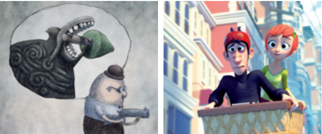
Footprints Jinxy Jenkins, Lucky Lou

20.15 Uhr (Wiederholung am Freitag, 17.30 Uhr) Best of International Animation 2014/15 (2)