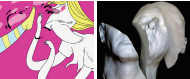
Limbo Limbo Travel Jazz for a Massacre

22.00 Uhr Best of International Animation 2014/15 (3)