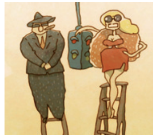
The Loneliest Stoplight

20.30 Uhr Best of International Animation 2015/16 (4)