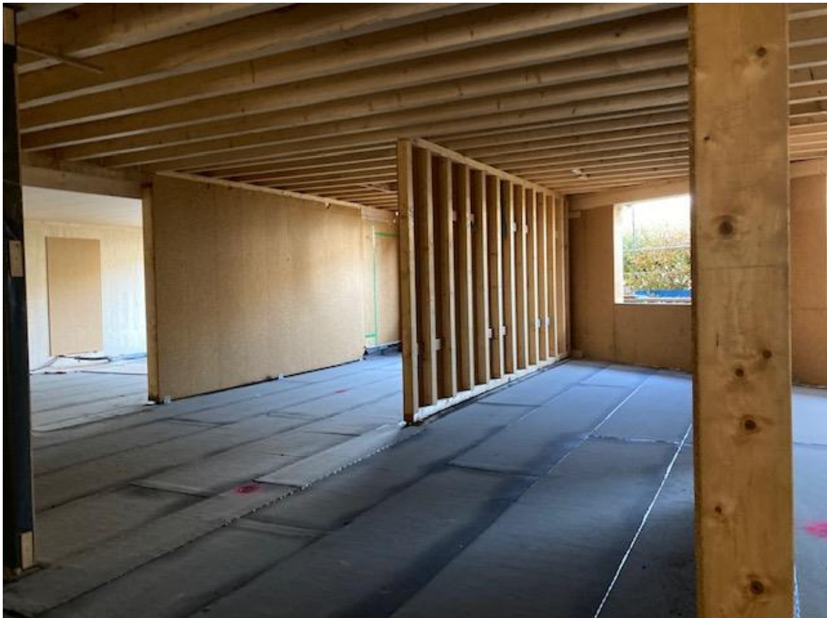
Ein Bild vom aufgeschlagenen Holzbau in der Kita

Beleuchtung: Es wird ein zurückhaltendes Beleuchtungskonzept umgesetzt. Die Flurzonen erhalten eine Indirektbeleuchtung, die Haupträume An- bzw. Einbauleuchten, welche über örtliche Schaltstellen gesteuert werden.