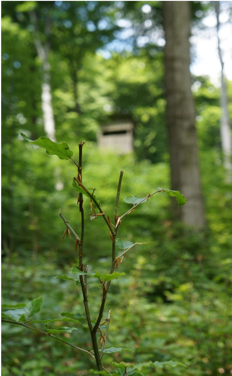
Abb.7: Verbissene Buche mit Hochsitz im Hintergrund