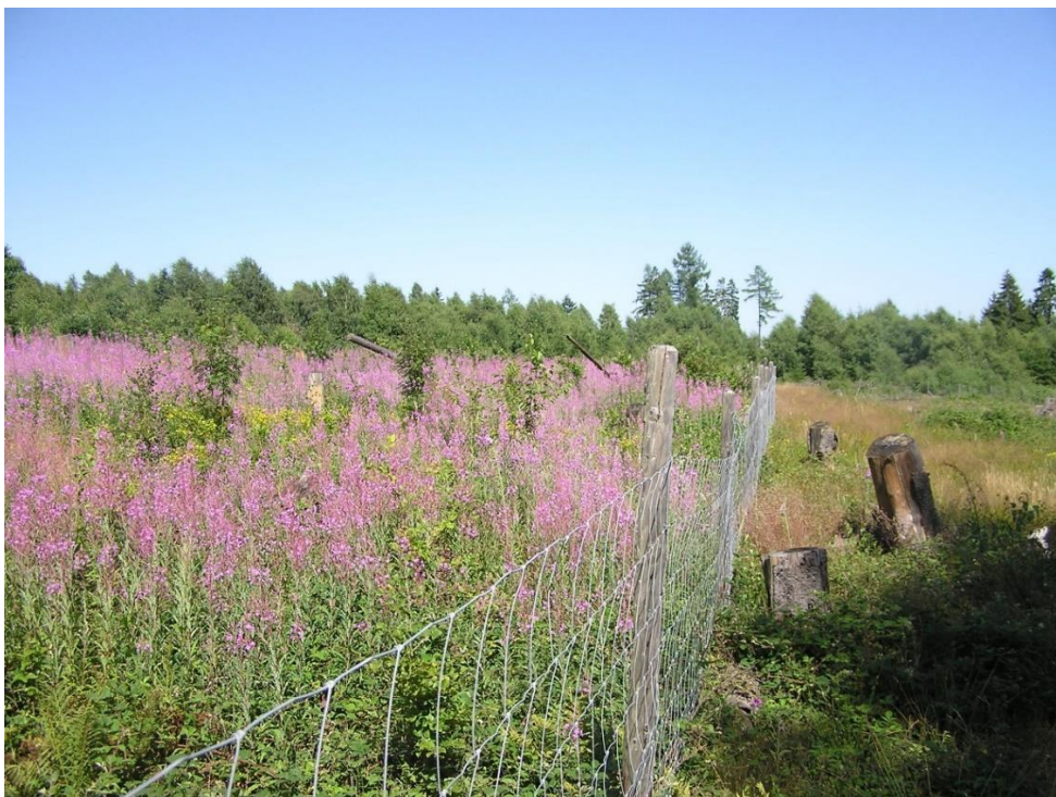
Wildverbissauswirkung: Vergleich gezäunte und ungezäunte Fläche. Der Schutz nachwachsender Bäume vor Verbiss ist aufwändig und teuer.

Der Verlust von Baumarten verringert die Schutzwirkung des Waldes. Folgen des Klimawandels wie Hitze, Trockenheit und Stürme können schlechter kompensiert werden und bringen Waldgebiete punktuell oder sogar flächig zum Absterben.