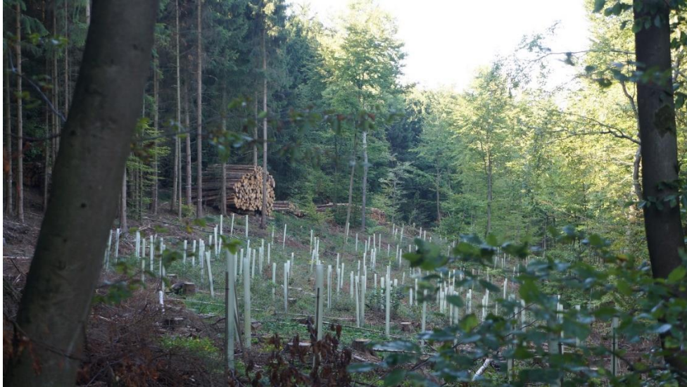
Abb.5: Aufforstung mit Einzelschutz

Um den Verbiss in Grenzen zu halten, wurden mit Zäunen um Schonungen und Einzelschutz bisher aufwändig sowie kostenintensiv Maßnahmen durchgeführt, die aber nicht in jeder Lage möglich sind.