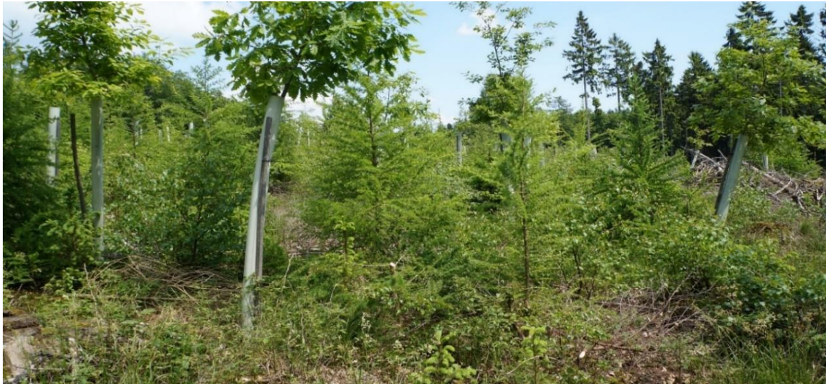
Gelungene Naturverjüngung durch Einzelpflanzung ergänzt

Der im Klimawandel notwendige Waldumbau wird nur erfolgreich sein, wenn er durch eine angepasste Bejagung unterstützt wird.