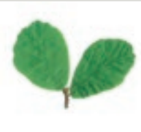
43 Parrotie Nordpersien Zaubernuss- gewächs

Jeder der 25 Steinquater ist einem Baum im Nerotalpark zugeordnet. Mittels der dazugehörigen Baumnummern können Sie die Bäume im Park suchen, finden und bestimmen.