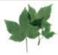
50 Berg-Ahorn Mitteleuropa Seifenbaum- gewächs