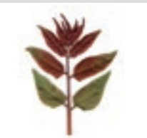
85 Götterbaum China Bitteresch- gewächs