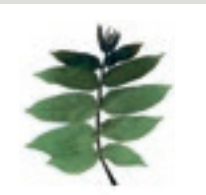
89 Kaukasische Flügelnuss Süd Europa Walnussgewächs