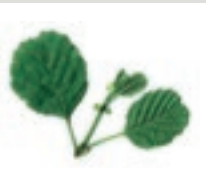
59 Erle Europa Birken- gewächs