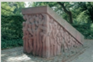
Karl Matthäus Winter BRUNNEN 1976 Bronze Adolfsallee/Kaspar-Kögler-Platz