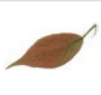
83 Jap. Blüten- Kirsche Kultivar Rosengewächs