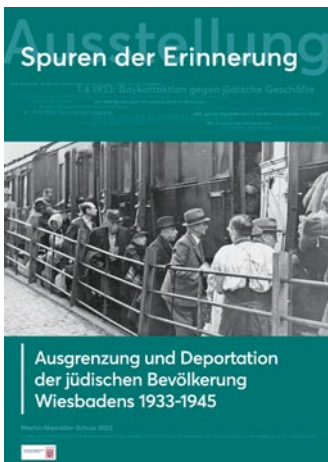
Plakat zur Ausstellung © Martin-Niemöller-Schule

Ziel der Ausstellung ist es, das Wissen über die Shoah lokalgeschichtlich zu konkretisieren, an lokale Erinnerungsorte zu koppeln und zu vermitteln. Zugleich soll eine Brücke zur Nachkriegsgeschichte und Gegenwart der Jüdischen Gemeinde geschlagen werden.