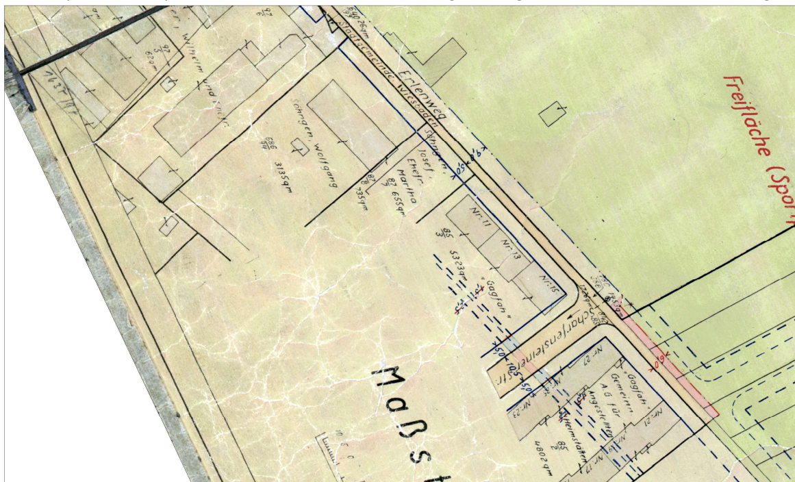
Plan aus dem Hessischen Aufbaugesetz

Erstellt: Stadtplanungsamt Gustav-Stresemann-Ring 15 65189 Wiesbaden stadtplanung@wiesbaden.de