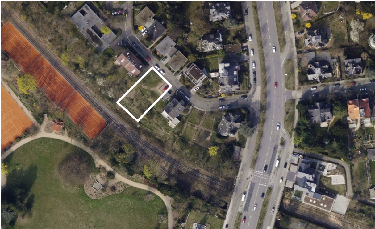
Luftbild (März 2011)