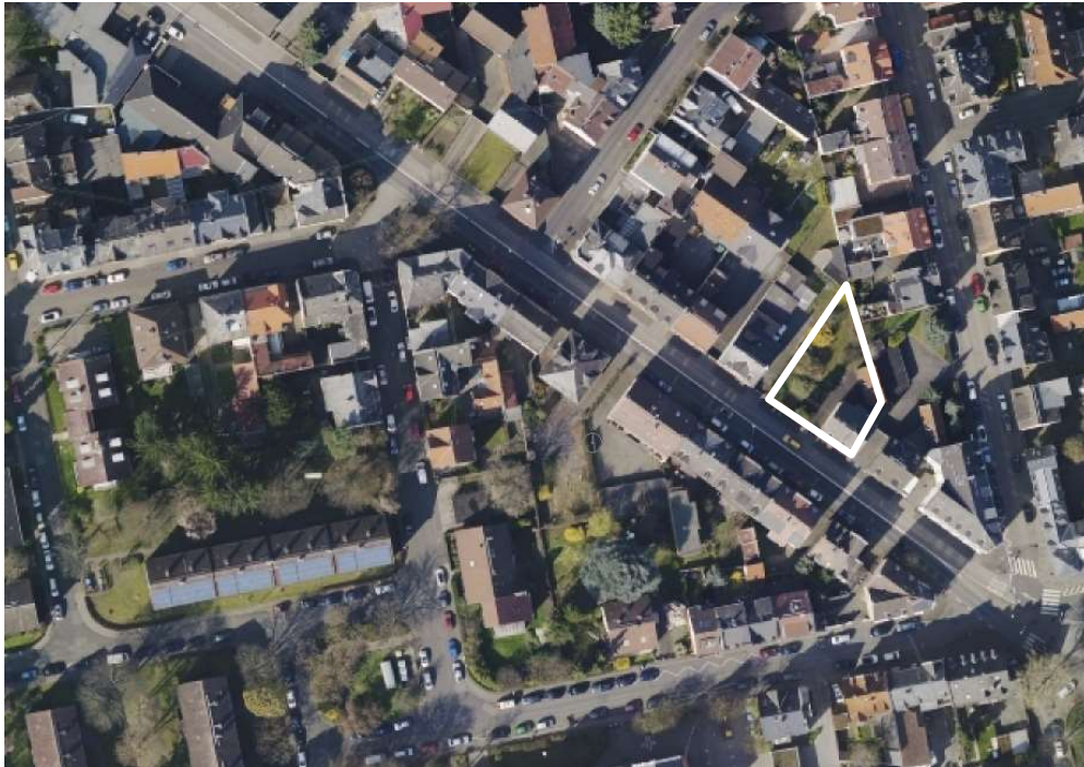
Luftbild (März 2014)

Erstellt: Stadtplanungsamt Gustav-Stresemann-Ring 15 65189 Wiesbaden stadtentwicklung@wiesbaden.de