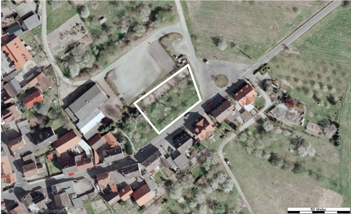
Luftbild (April 2003)