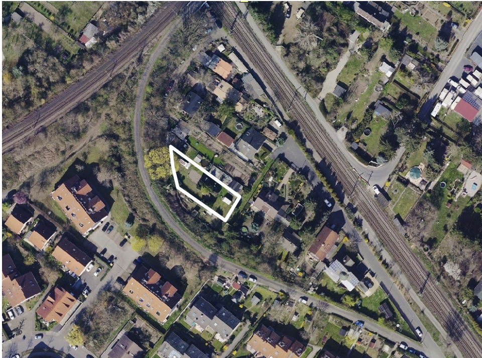
Luftbild (März 2014)