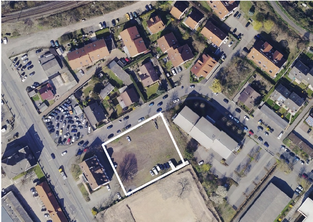
Luftbild (März 2014)