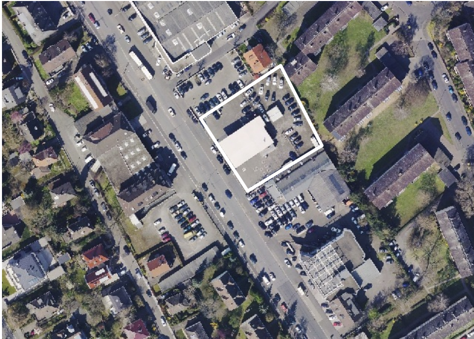
Luftbild (März 2014)