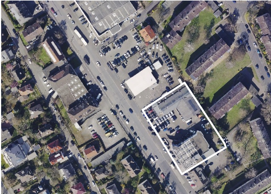
Luftbild (März 2014)