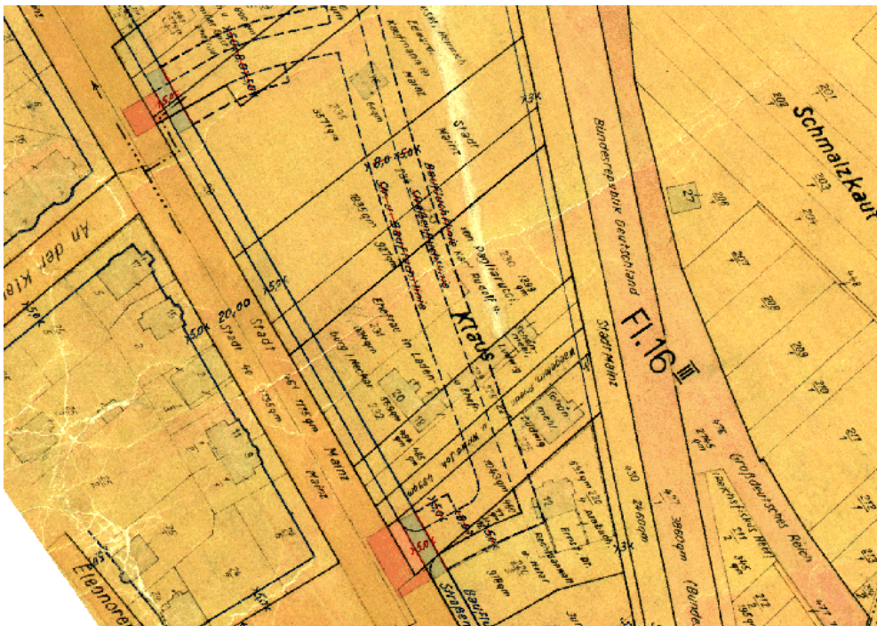
Ausschnitt aus dem Plan nach dem Hessischen Aufbaugesetz

Erstellt: Stadtplanungsamt Gustav-Stresemann-Ring 15 65189 Wiesbaden stadtentwicklung@wiesbaden.de