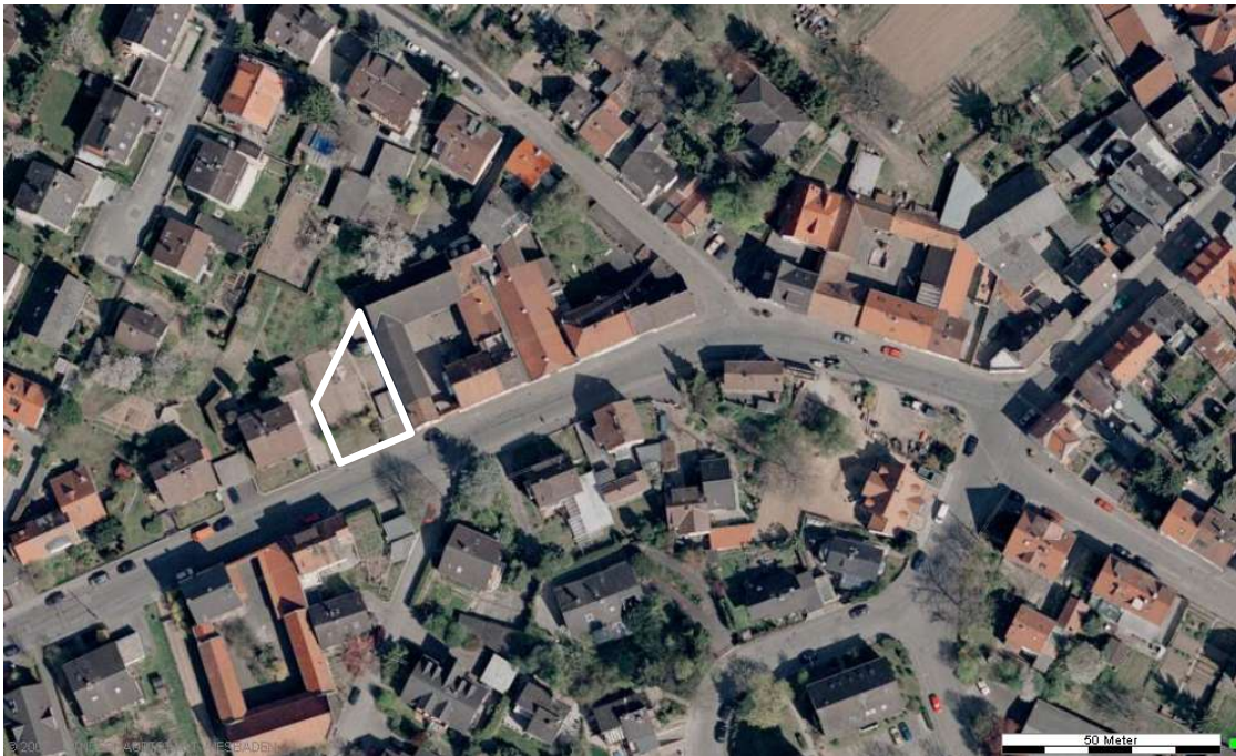
Luftbild (April 2003)