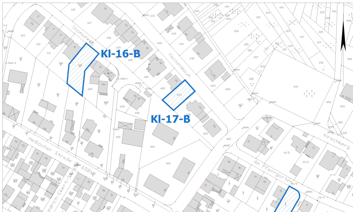
Ausschnitt aus der Stadtgrundkarte