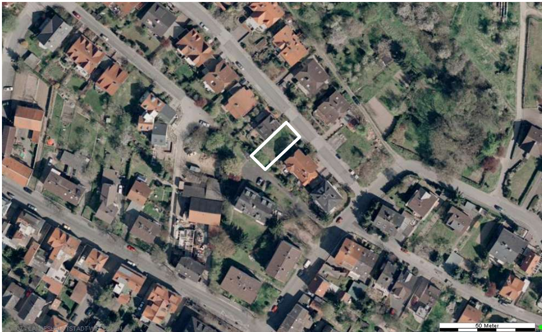
Luftbild (April 2003)