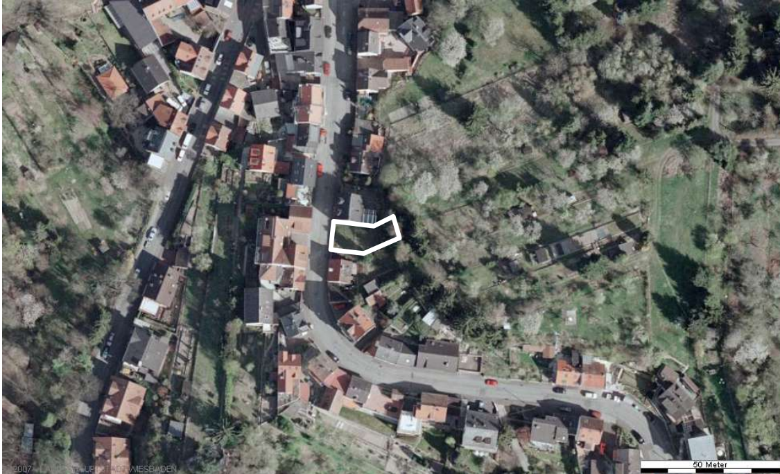
Luftbild (April 2003)

Erstellt: Stadtplanungsamt Gustav-Stresemann-Ring 15 65189 Wiesbaden stadtplanung@wiesbaden.de