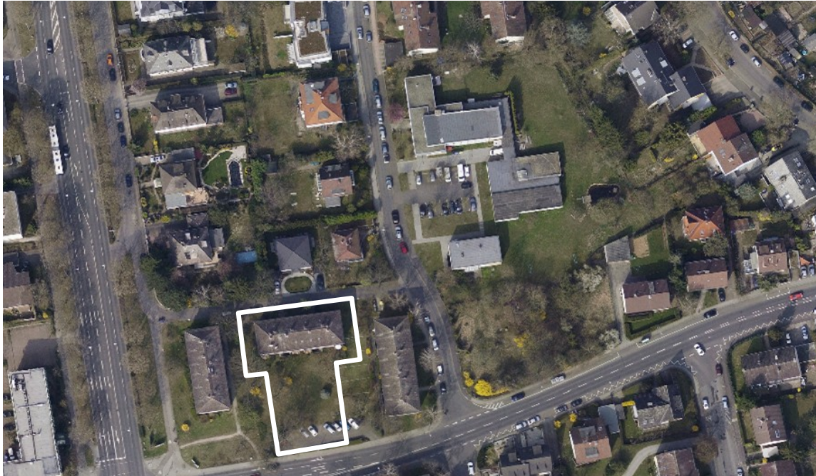
Luftbild (März 2011)