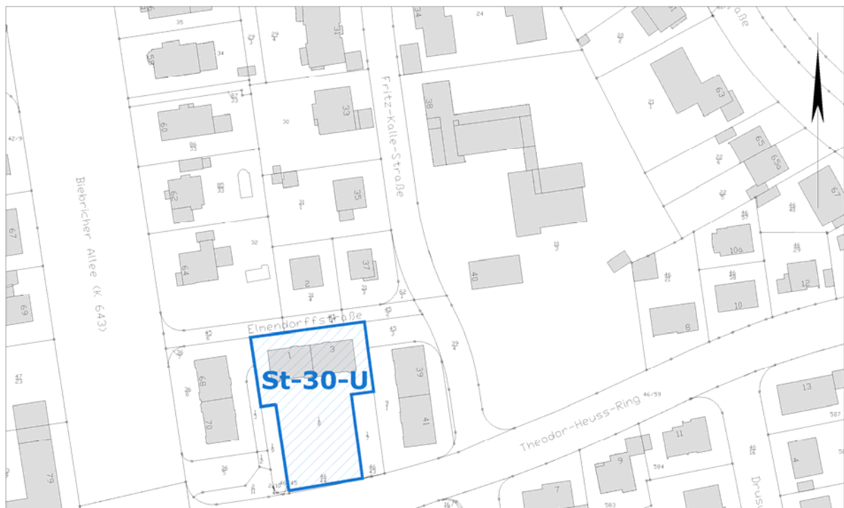
Ausschnitt aus der Stadtgrundkarte