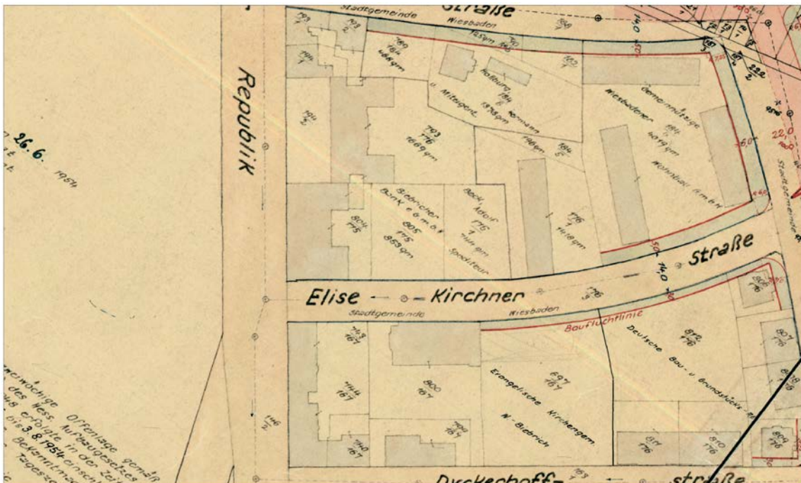
Ausschnitt aus dem Plan nach dem Hessischen Aufbaugesetz

Erstellt: Stadtplanungsamt Gustav-Stresemann-Ring 15 65189 Wiesbaden stadtplanung@wiesbaden.de