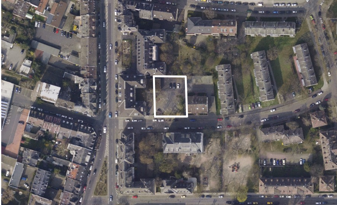
Luftbild (März 2011)