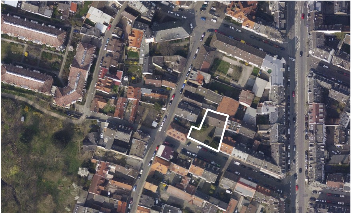
Luftbild (März 2011)