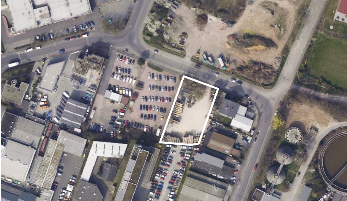
Luftbild (März 2011)