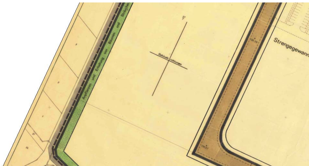
Ausschnitt aus dem Bebauungsplan

Erstellt: Stadtplanungsamt Gustav-Stresemann-Ring 15 65189 Wiesbaden stadtentwicklung@wiesbaden.de