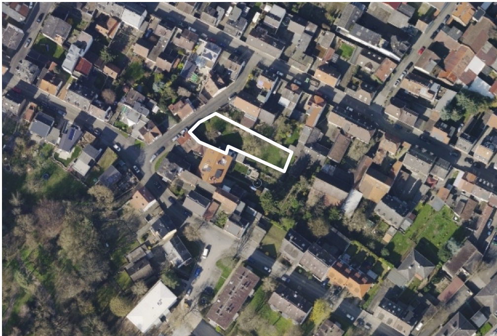
Luftbild (März 2014)