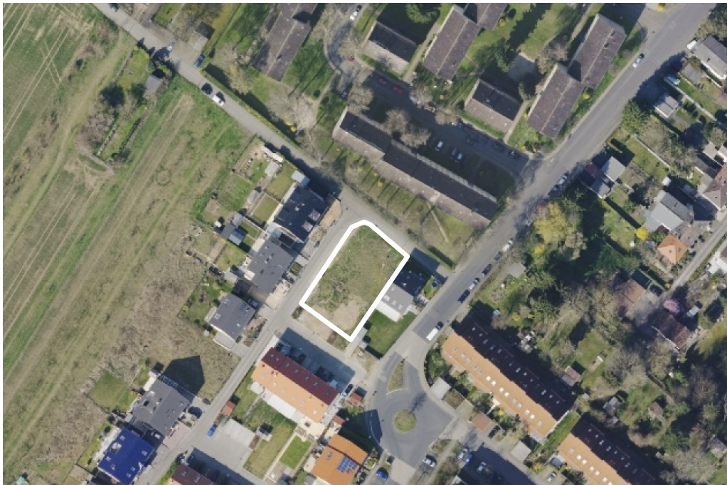
Luftbild (März 2014)