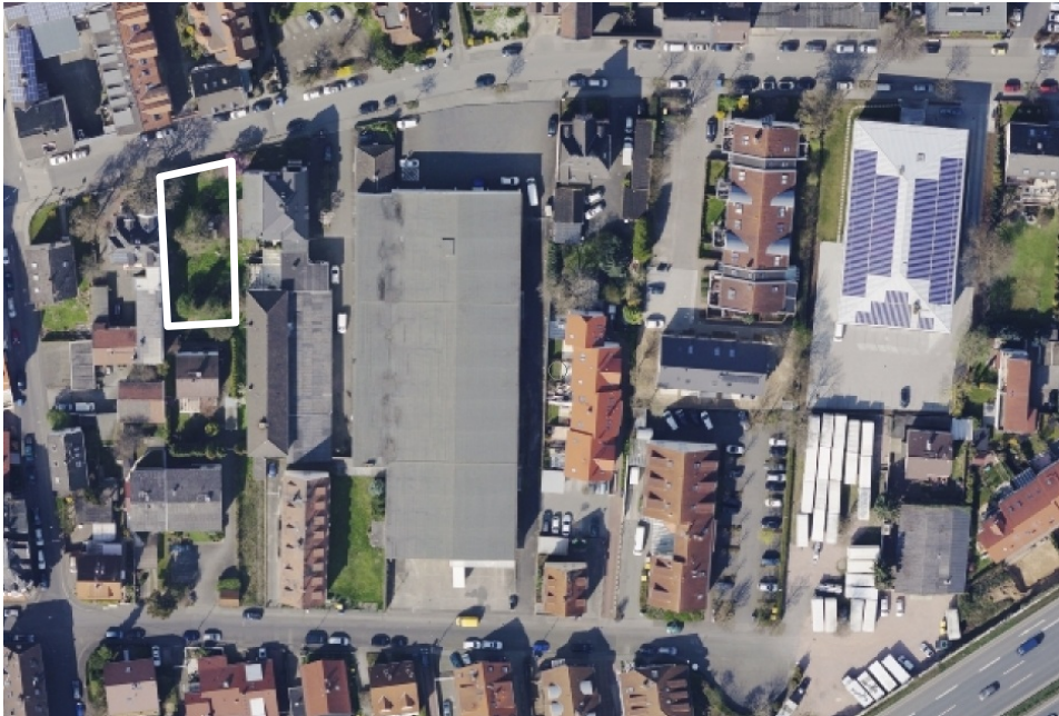
Luftbild (März 2014)