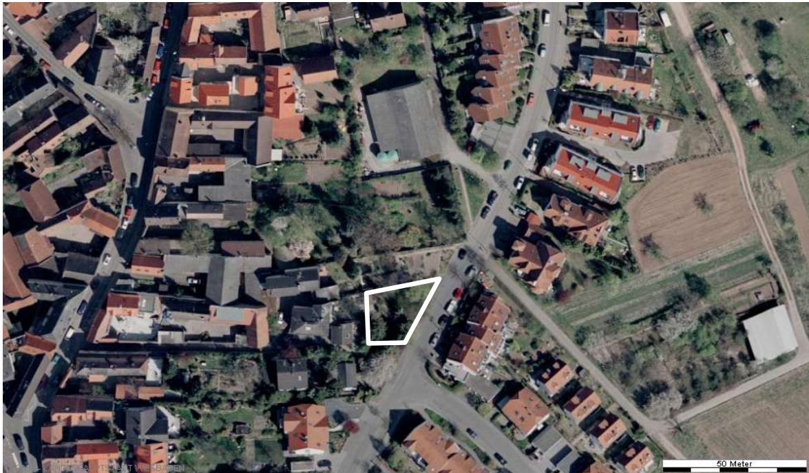
Luftbild (April 2003)