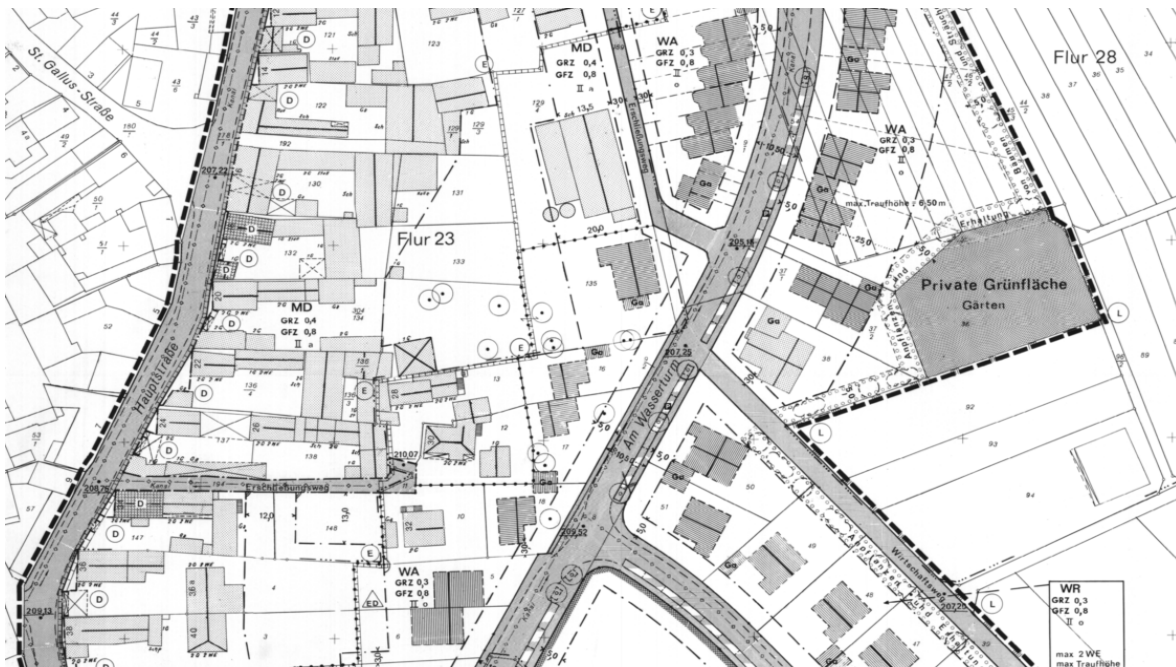
Ausschnitt aus dem Bebauungsplan

Erstellt: Stadtplanungsamt Gustav-Stresemann-Ring 15 65189 Wiesbaden stadtplanung@wiesbaden.de