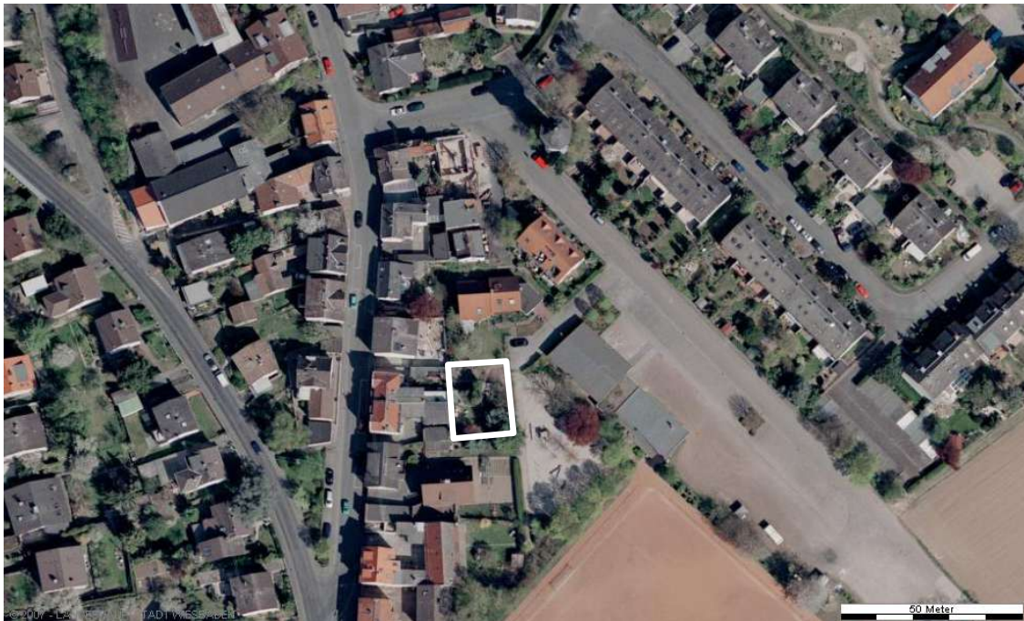
Luftbild (April 2003)