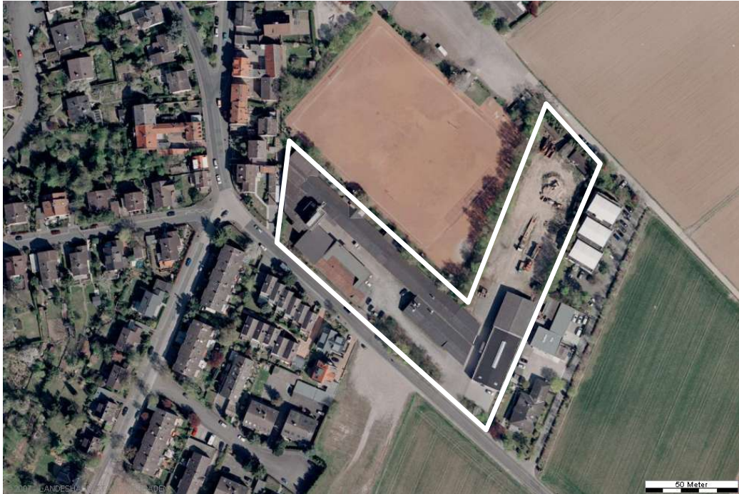
Luftbild (April 2003)