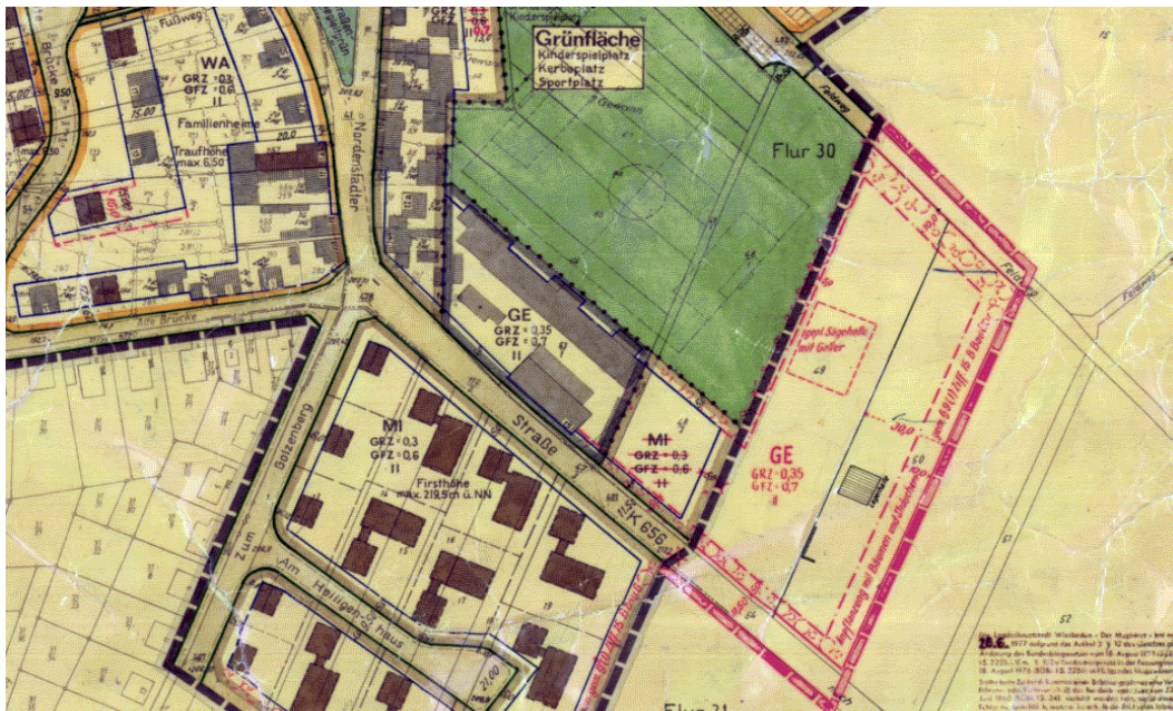
Ausschnitt aus dem Bebauungsplan (Rechtsverbindliche Änderungen sind rot eingetragen)

Erstellt: Stadtplanungsamt Gustav-Stresemann-Ring 15 65189 Wiesbaden stadtplanung@wiesbaden.de