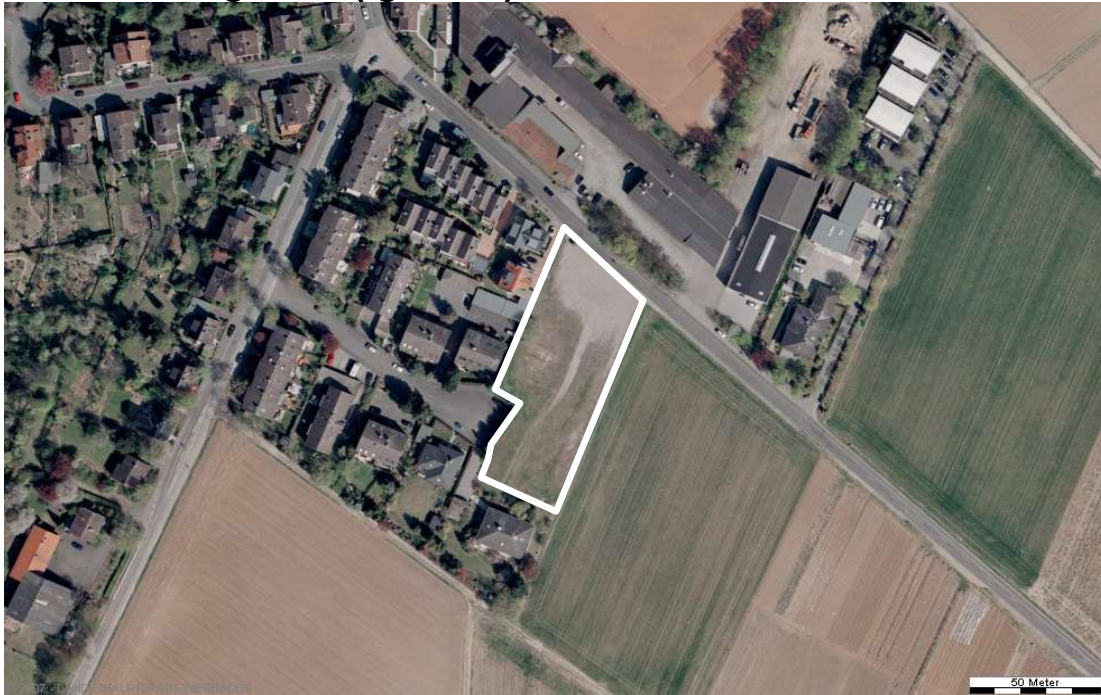
Luftbild (April 2003)