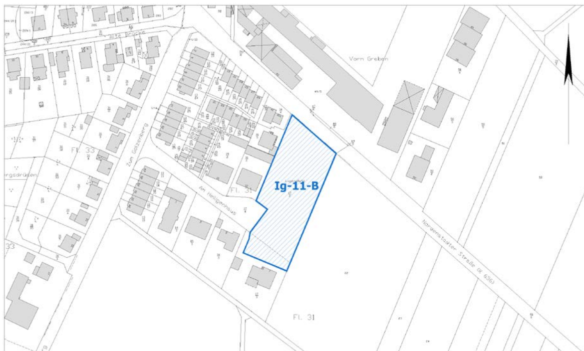
Ausschnitt aus der Stadtgrundkarte