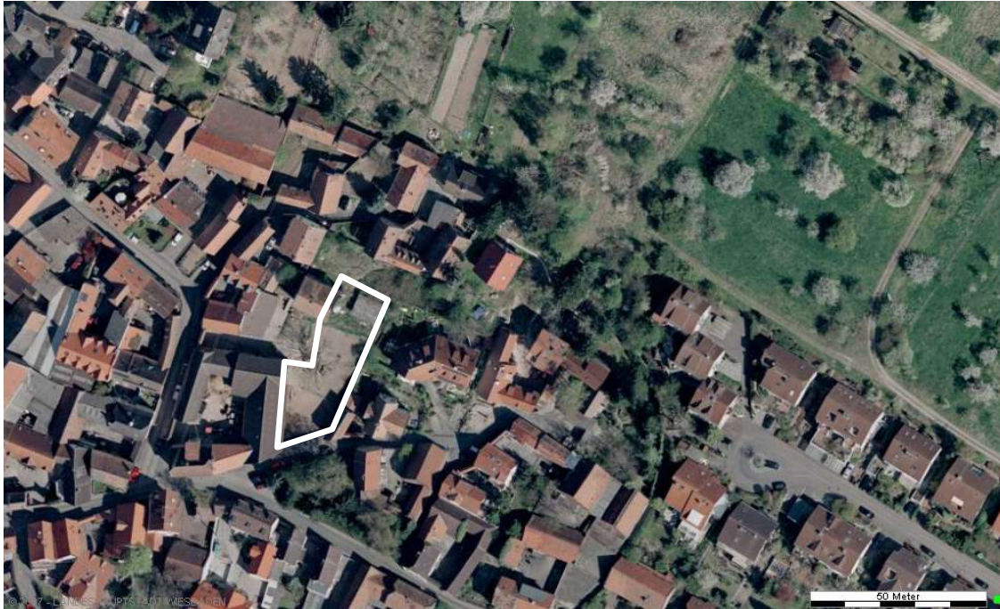
Luftbild (April 2003)

Erstellt: Stadtplanungsamt Gustav-Stresemann-Ring 15 65189 Wiesbaden stadtplanung@wiesbaden.de