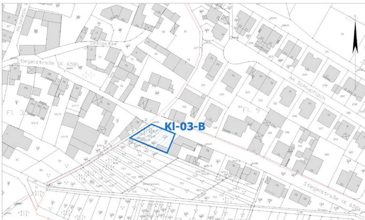
Ausschnitt aus der Stadtgrundkarte