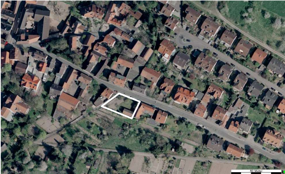
Luftbild (April 2003)