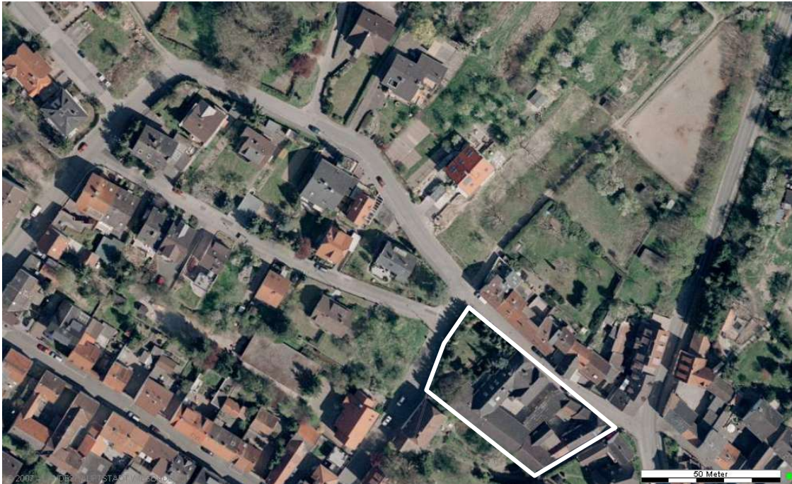
Luftbild (April 2003)

Erstellt: Stadtplanungsamt Gustav-Stresemann-Ring 15 65189 Wiesbaden stadtplanung@wiesbaden.de