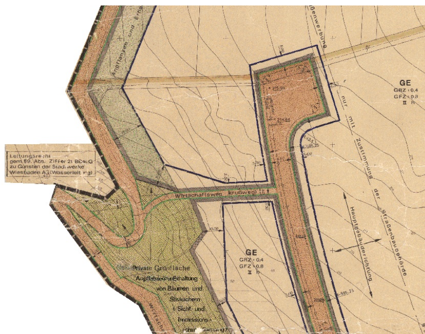
Ausschnitt aus dem Bebauungsplan

Erstellt: Stadtplanungsamt Gustav-Stresemann-Ring 15 65189 Wiesbaden stadtentwicklung@wiesbaden.de