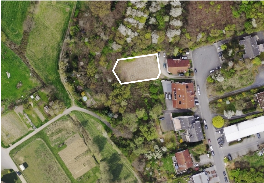
Luftbild (März 2014)