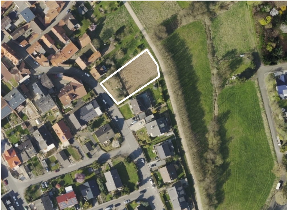
Luftbild (März 2014)