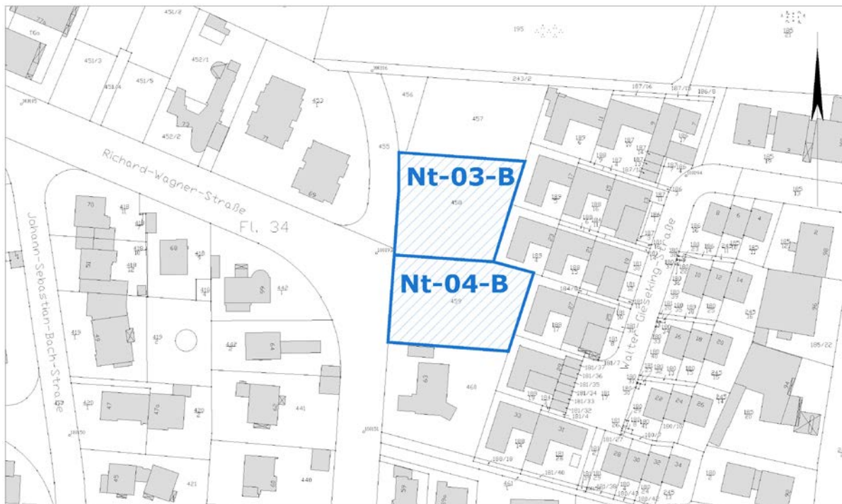
Ausschnitt aus der Stadtgrundkarte