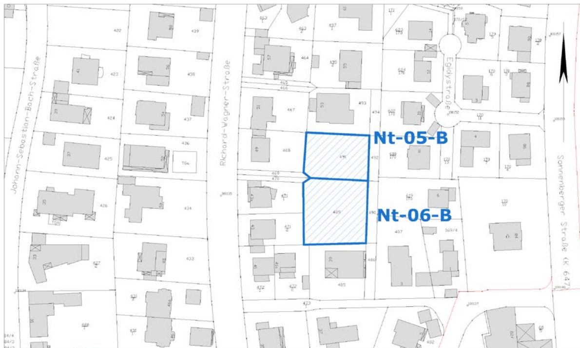
Ausschnitt aus der Stadtgrundkarte