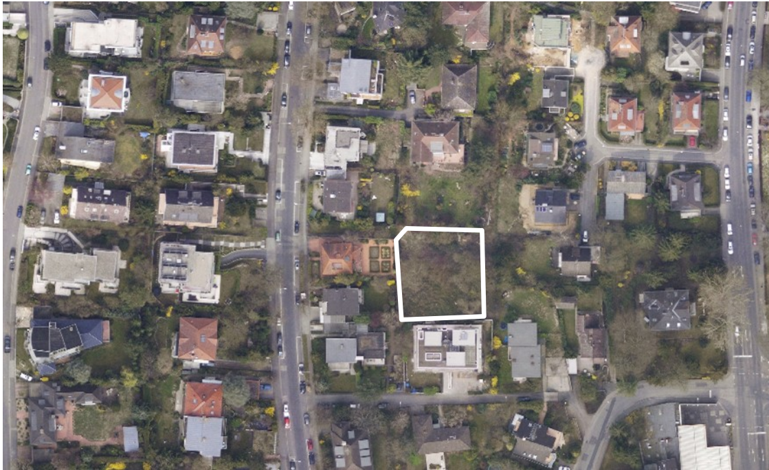
Luftbild (März 2011)

Kartengrundlage Tiefbau- und Vermessungsamt