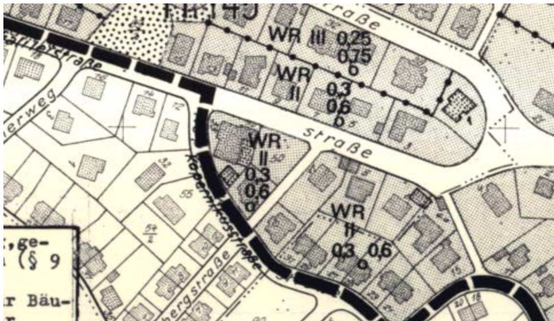
Ausschnitt aus dem Bebauungsplan

Erstellt: Stadtplanungsamt Gustav-Stresemann-Ring 15 65189 Wiesbaden stadtplanung@wiesbaden.de