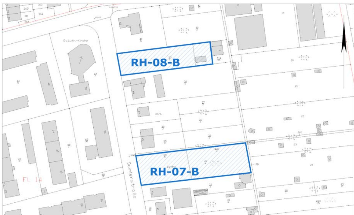
Ausschnitt aus der Stadtgrundkarte

Anmerkungen: Wiesbaden 1961/10 Plan nach dem Hessischen Aufbaugesetz, der nur Bau- und Straßenfluchtlinien festsetzt. Im Übrigen erfolgt die Beurteilung nach § 34 BauGB - Zulässigkeit von Vorhaben innerhalb der im Zusammenhang bebauten Ortsteile.