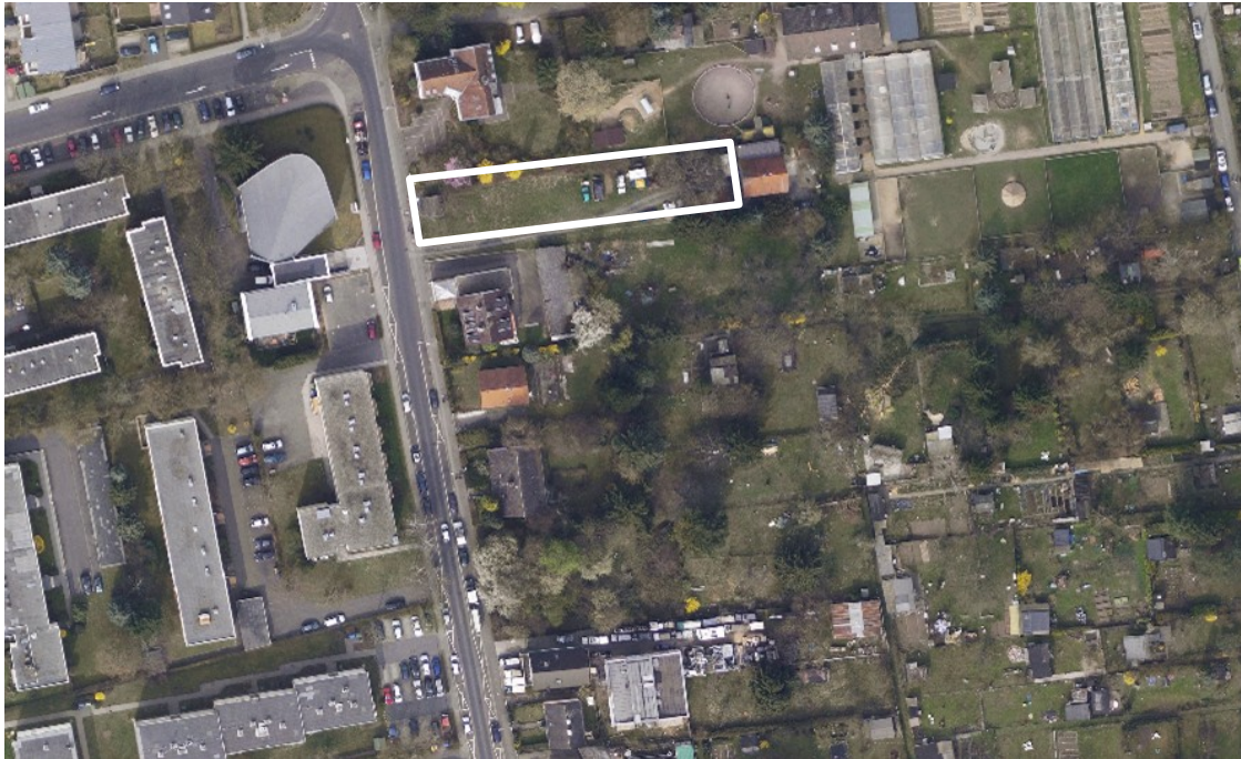
Luftbild (März 2011)